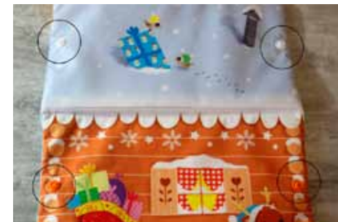
Pressions parties mâles

Pour poser ceux du chalet, passer votre main à l'intérieur.