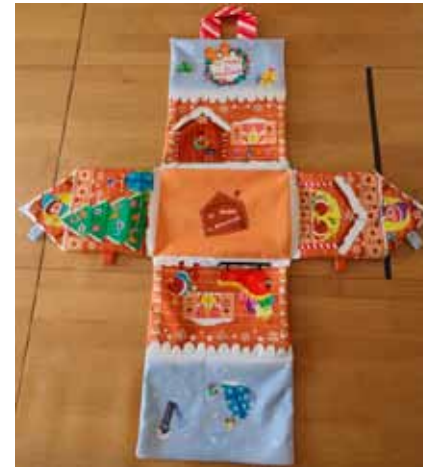
Pressions parties femelles