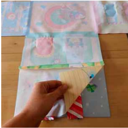
Photo tirée de la maison des fées mais c'est le même principe ! Laisser l'ouverture là où il n'y a pas de poignée. ➔

Recouvrez le tout du corps intérieur du chalet, endroit contre endroit ! (plafond contre toit/titre). Prenez le temps de bien ajuster ces deux parties et épinglez.